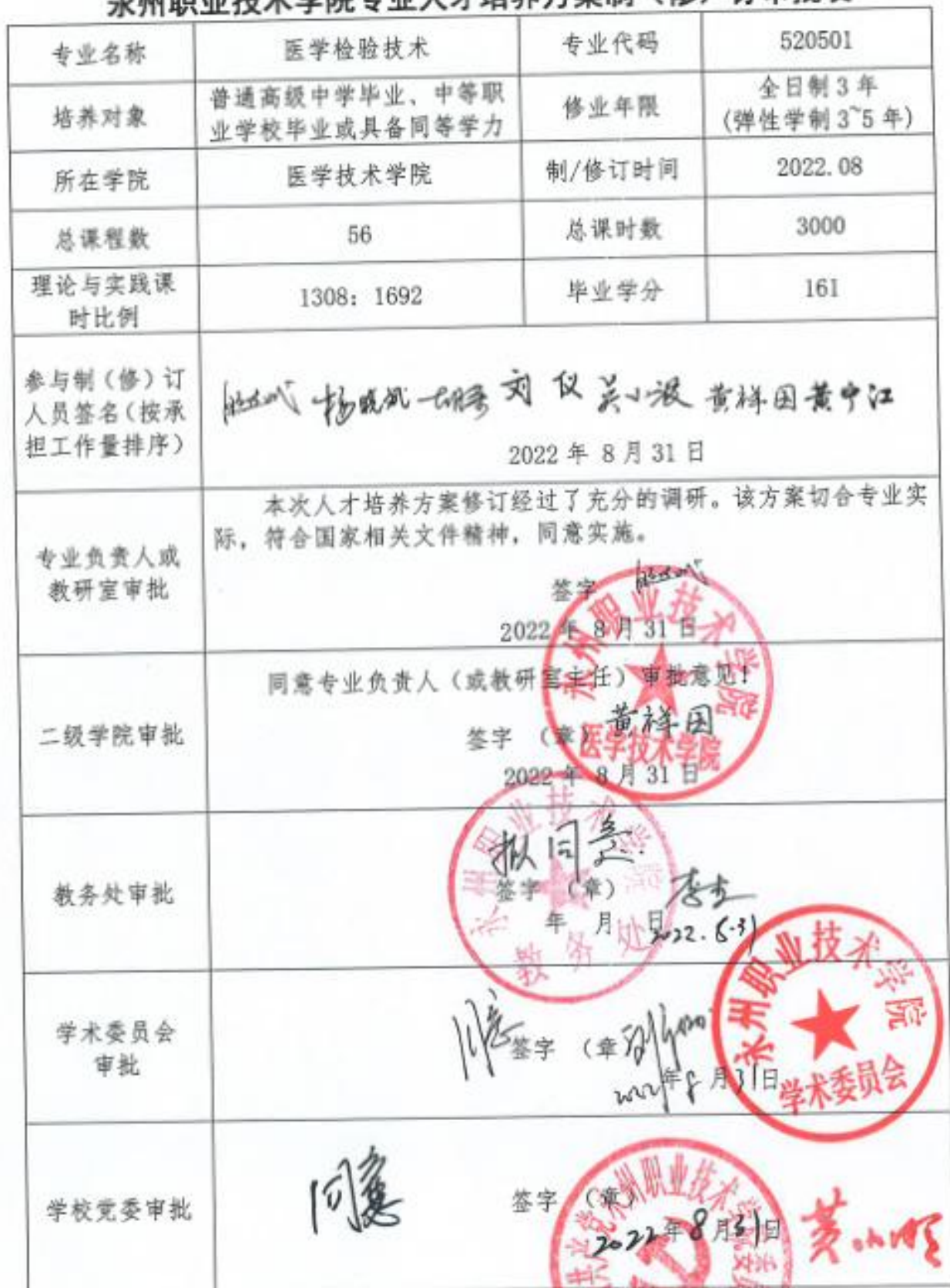
永州职业技术学院专业人才培养方案制(修)订审批表