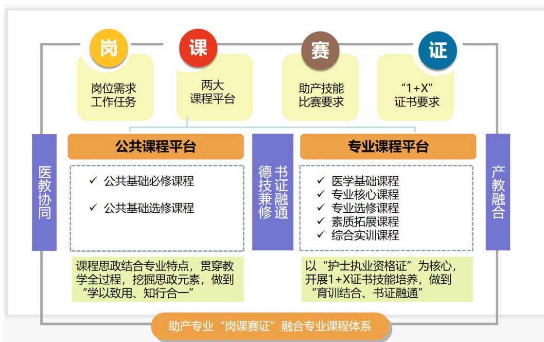
图2 构建助产专业“岗课赛证”融合课程体系