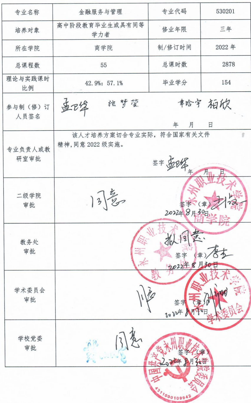
永州职业技术学院专业人才培养方案制（修）订审批表