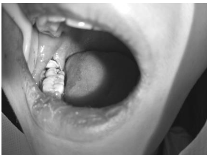
图 3 高速涡轮手机分牙，去除近中阻力