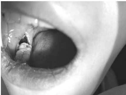
图 5 右下第三磨牙完全拔出后