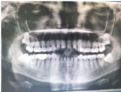
图 2 右下第三磨牙近中高位阻生，融合根，根尖距下牙槽神经管较远。