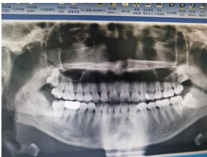
图 6 右下第三磨牙完全拔出后曲面体层摄影，显示牙齿完全拔出，无断根