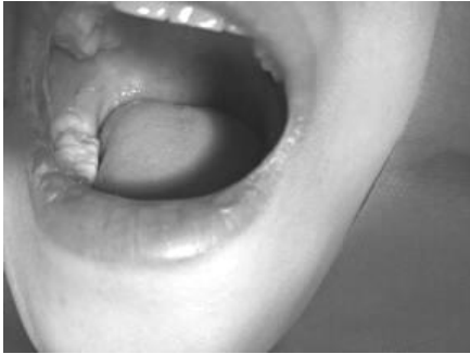
图 1 右下第三磨牙近中向部分萌出，远中龈瓣覆盖