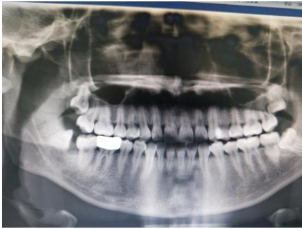
图 4 分牙后曲面体层摄影，确保完全去除临牙阻力。